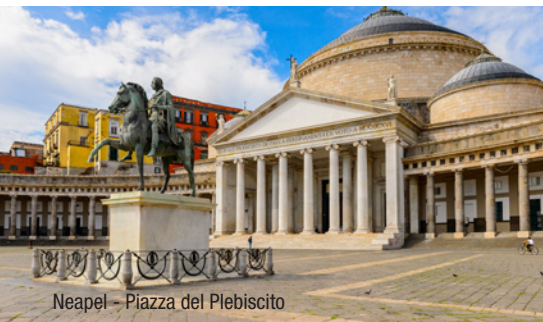
Neapel - Piazza del Plebiscito